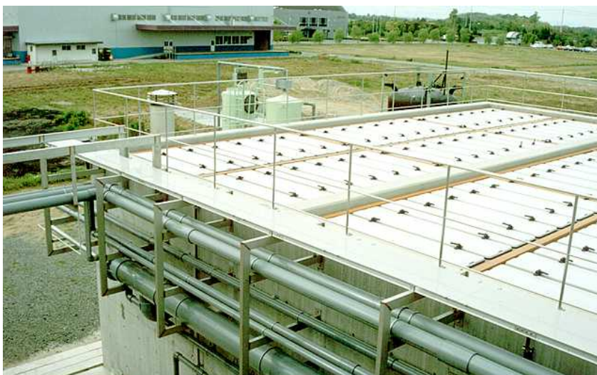
Ejemplo de una planta EDAR tipo RALF para Pres. Franco